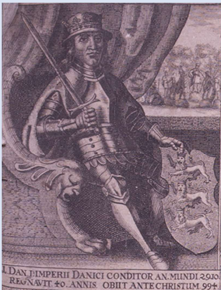
Nr. 1 - Kong Dan, 994 f.Kr.

Omkring 1000 f.Kr. eksisterede "Danmark" ikke som en samlet politisk enhed eller et navn. Navnet "dane" optræder først i skriftlige kilder omkring 500-tallet e.Kr.