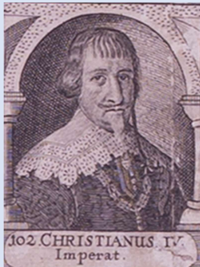
Nr. 102 - Kong Chr. 4., 1588 - 1648

Omkring 1000 f.Kr. eksisterede "Danmark" ikke som en samlet politisk enhed eller et navn. Navnet "dane" optræder først i skriftlige kilder omkring 500-tallet e.Kr.